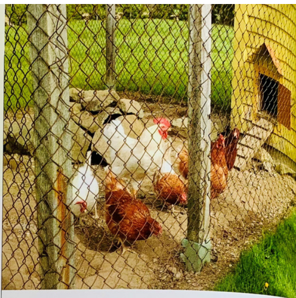
Le poulailler et les poules d'André Babin en juin 2021.

Stanislas et Rose tiendront tous deux des rôles actifs dans la gestion du couvoir : un travail qu'ils entretiennent jusqu'à la maison où ils possèdent un poulailler. Élever des poules offre plusieurs avantages : en plus de fournir des œufs frais, les poules sont omnivores et peuvent facilement être nourries avec des restes de tables ou les produits du potager. Finalement, les poules qui ne pondent pas peuvent être mangées. Le poulailler est également favorable à l'entretien d'un potager puisque le fumier de poule contient de l'azote et du carbone qui forment un fertilisant naturel de qualité.