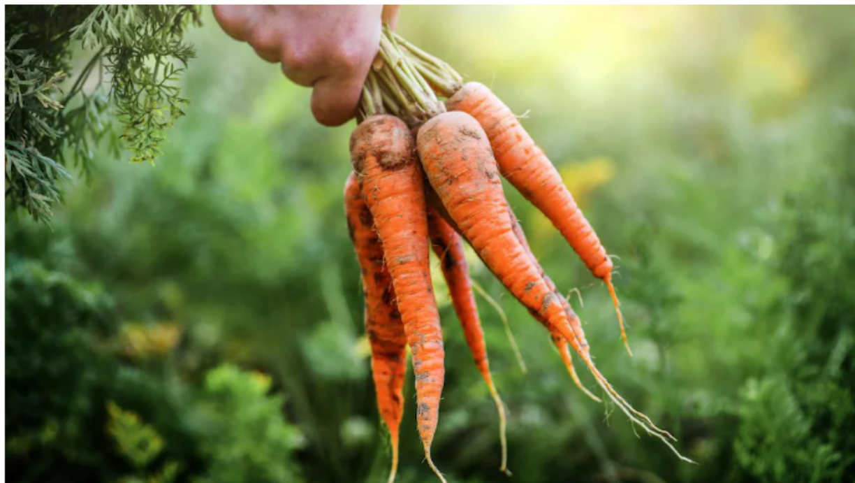
À quoi ressemblaient les potagers de nos ancêtres ?