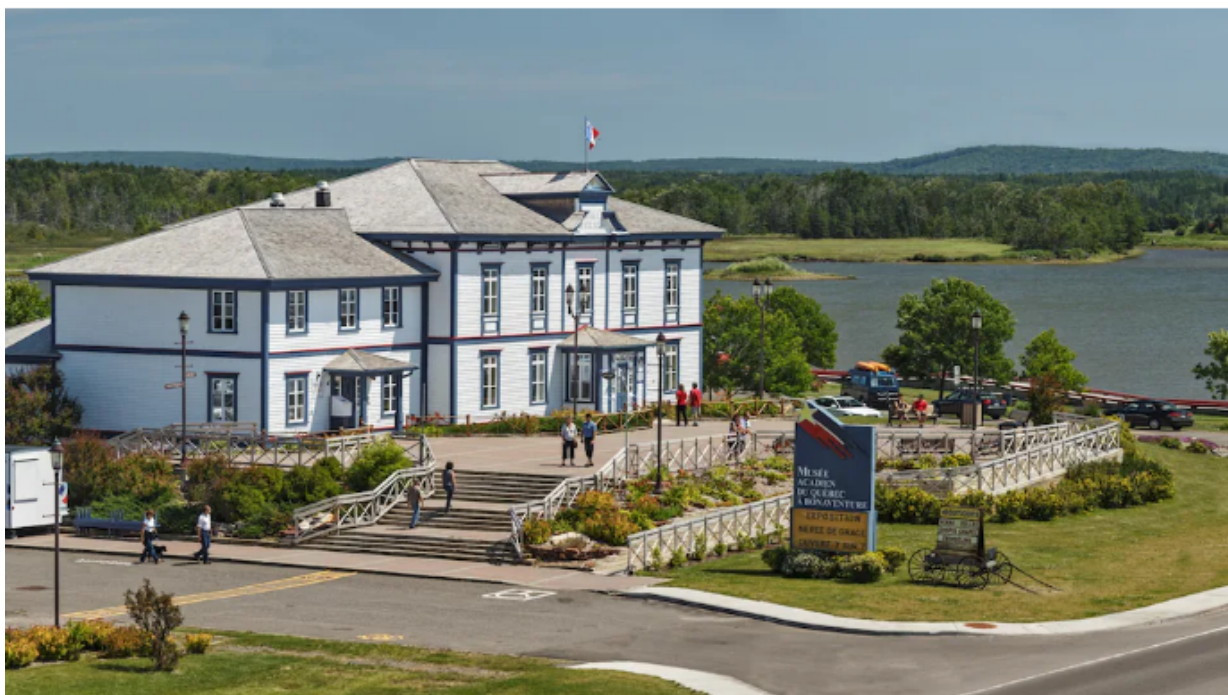
Le Musée acadien du Québec à Bonaventure