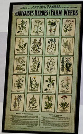
Affiche couleur 86 x 48 cm, préparé par Omer Caron et Georges Maheux en 1930.

En 1943, il est élu vice-président du Conseil provincial d'agriculture puis président en 1946. Il fut également membre du conseil d'administration de la Société zoologique de Québec de 1944 à 1946. En 1948, il fut membre du Comité du centenaire des Sœurs de la Charité de Québec.